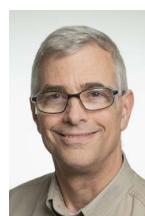
Pâte mécanique George Court Irving Paper