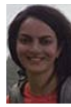
Blanchiment Honey Nampak Harmac Pacific