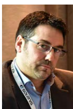
Énergie Serge Bédard Natural Resources Canada